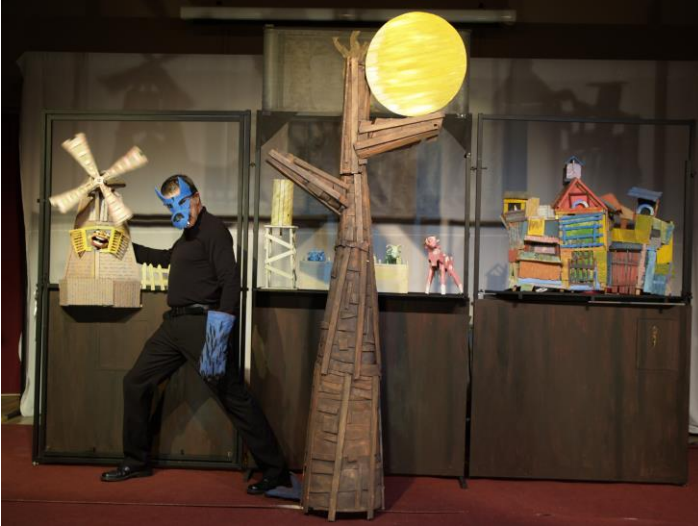
COLECTIVO HUMO - Navarra “Hambre de lobo” 28.11.13 – 11.00 y 14.00 – LEIDOR Público escolar concertado

Cuando el sol salía, el gallo cantaba. Entonces el campanero hacía sonar la campana de la iglesia. Y todo el pueblo se ponía en movimiento. Una tarde de otoño un benteveo se acercó a conversar con el gallo...: “Vives encerrado. Crees que todo empieza y termina en tu gallinero. ¡Y hay tanto que ver detrás de tu alambrado! Hay ríos, bosques, montañas, mar...”