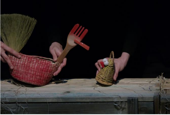
LA CANICA - Madrid “El gallo de las veletas” 27.11.13 – 11.00 y 14.00 – TOPIC Público escolar concertado

Era un gallo que vivía en un gallinero. Sus padres, sus abuelos, sus bisabuelos y sus tatarabuelos habían vivido siempre en ese mismo gallinero.